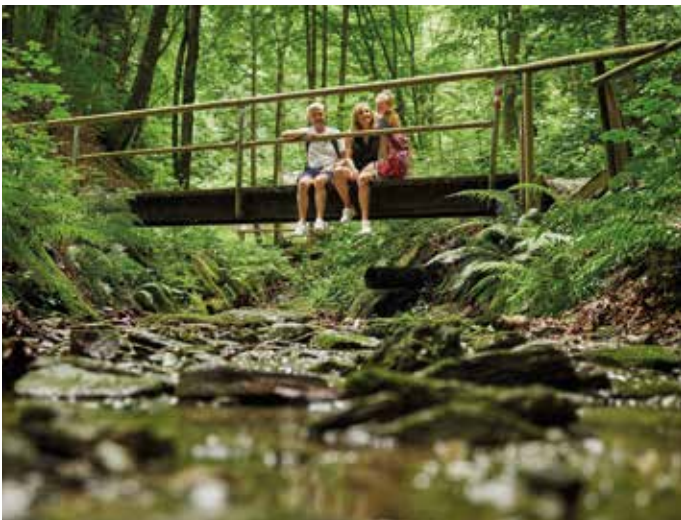
Schattige Wanderwege in wunderbarer Naturlandschaft begeistern.

Die Oststeiermark begeistert mit einer Vielzahl an Möglichkeiten zur Tagesgestaltung. Ob draußen in der Natur oder in sagenumwobenen Gemäuern – hier findet sich alles, was das Urlauberherz begehrt: Badespaß im Stubenbergsee, im einzigartigen Fluss- und Familienerlebnisbad in St. Ruprecht an der Raab oder in einem der zahlreichen