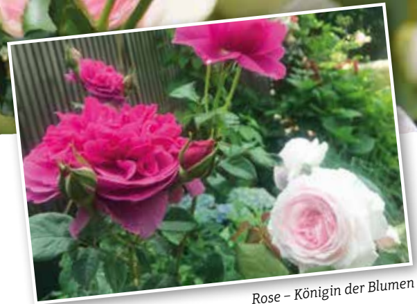
Rose – Königin der Blumen

gar nicht an und gehen bald zugrunde. Die Ursache ist eine „Bodenmüdigkeit“, die durch Wurzelausscheidungen entsteht. Für ein prächtiges Wachstum der neuen Rose ist ein Erdaustausch notwendig. Die Erde des alten Rosenbeetes 60 cm tief ausheben und mit unverbrauchter, gesunder Ackererde (Gartenerde, Humus) ersetzen. Die „verbrauchte“ Erde kann im Garten ohne Nachteil für andere Pflanzen wiederverwendet werden. Bei der Pflanzung der neuen Rose unbedingt eine hochwertige Pflanzerde z.B. unsere Hausmischung „Höfler Spezialerde“ dazumischen, damit die Rose ausreichend mit Nährstoffen versorgt ist. Der große Aufwand wird sich bald lohnen – die neu gepflanzte Rose wird prächtig wachsen!