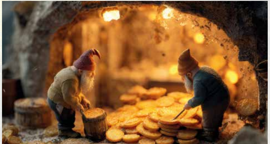
Nur nicht erwischen lassen! Nächtens gingen die umtriebigen Bäckerzwerge ihrer Arbeit nach.

Ja, manches taucht aus den Tiefen des Vergessens wieder auf, doch bei manchen Dingen muss man sehr vorsichtig sein, damit sie bleiben, so wie diese Sage erzählt: