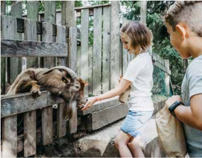
Im Waldpark kommen alle Kinder und Tierliebhaber auf ihre Kosten.