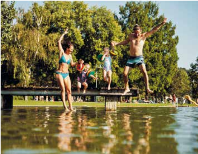
Badespaß pur am Stubenbergsee oder in den zahlreichen Freibädern

Ankommen - Durchatmen - Loslassen: Willkommen in der Oststeiermark - einer Region, die durch ihre Vielfalt begeistert, mit gelebter Tradition berührt und mit moderner Leichtigkeit überrascht. Hier trifft ländlicher Charme auf das urbane Flair der Städte, und gemeinsam formen sie ein unverwechselbares Stück Lebensfreude mitten in der Natur.