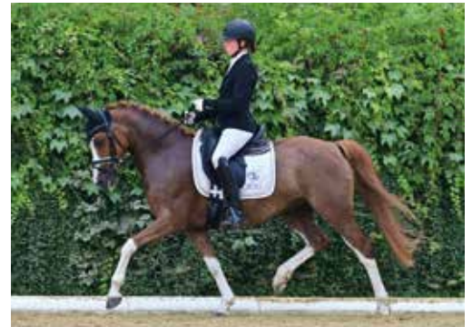
Suchbild mit Pferd und Mensch: Tochter und Mutter – Finde den Unterschied.

Die Pferdeliebe liegt in der Familie – mittlerweile grasen schon bald seit 40 Jahren Pferde und Ponys auf den saftig-grünen Wiesen beim Hoadnbauer.