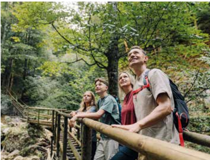
Naturwunder Bärenschützklamm – ein unvergesslicher Ausflug