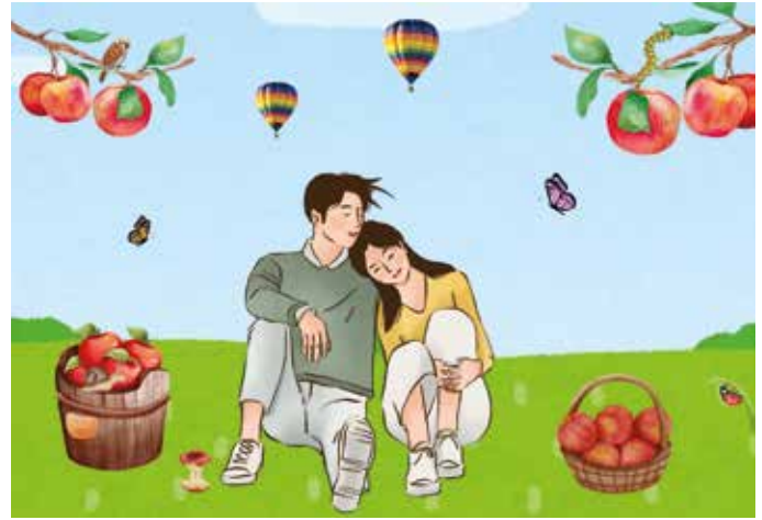
Unser Apfelstraßen-Suchbild! Aber da stimmt doch was nicht! Suche die 10 Unterschiede!