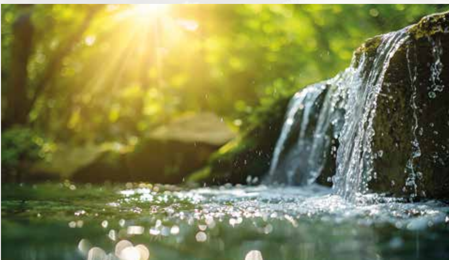
Mystische Naturbesonderheit: Aus so manchen Quellen im Apfelland fließt heilkräftiges Wasser.

Seid also vorsichtig, wenn ihr auch fleißige Helfer habt, und vergesst nicht, die Vorhänge zuzuziehen, damit man euer Geheimnis nicht entdeckt!