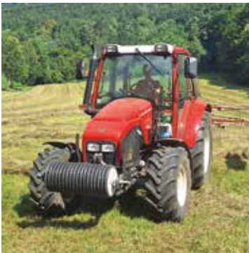
Die Jugend ist bereits eine große Hilfe!