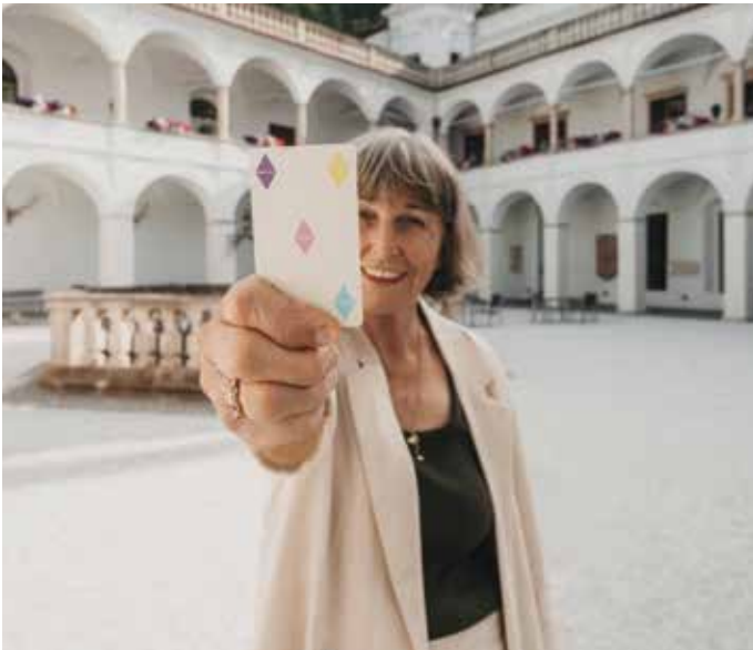
Mit der „Genuss-Card“ kostenlos die oststeirische Vielfalt entdecken.

Egal ob erste Trail-Versuche, eine entspannte Familienrunde oder sportliche Herausforderung – die zahlreichen Strecken bieten für jedes Level den passenden Trail. Und wer noch mehr Action will, steigt um auf die Mountaincarts: Diese geländetauglichen Carts sind eine Mischung aus Go-Kart und Sommerrodel und bieten rasanten Downhill-Spaß für Groß und Klein.