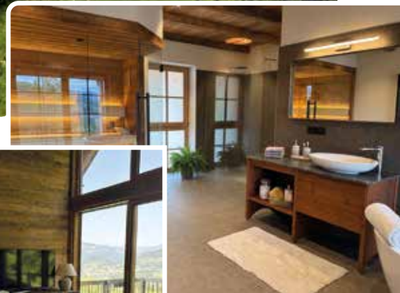
Wohlfühllose Bad und ein Traumblick aus dem Wohnzimmer der alten Mühle laden ein...