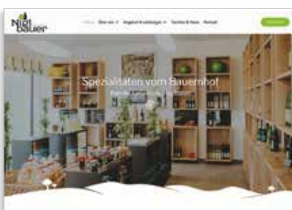
Unsere neue Website voll köstlicher Vielfalt...

Auch in der digitalen Welt tut sich rasant viel, somit war unsere Homepage nach einiger Zeit nicht mehr am neuesten Stand. So war es für uns ein Muss, unsere Homepage www.niglbauer.at neu aufzustellen. Auf den ersten Blick ein gewohntes Bild, doch beim Durchschauen und Einkaufen im Webshop erkennt man schon das Neue. Dort und da findet man auch Videos, die zeigen, was sich hinter den Kulissen am Niglbauer-Hof so tut.