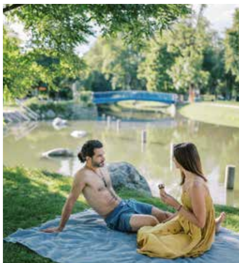
Einzigartiges Flussbad St. Ruprecht an der Raab

Also auch bei großer Hitze weiß das Genussparadies zu überzeugen. Ob Groß oder Klein, auf der Apfelstraße findet jeder sein Sommervergnügen!