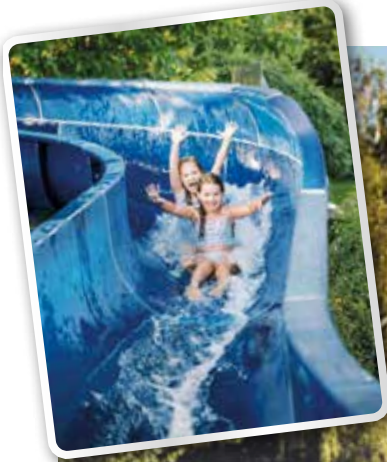
Badevergnügen am Stubenbergsee