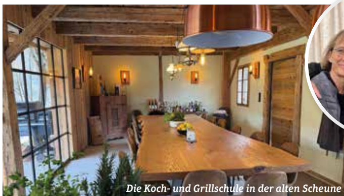
Die Koch- und Grillschule in der alten Scheune

Lust, Ihre Kenntnisse im Grillen oder Kochen zu erweitern? Bei den Seminaren erhalten Sie Tipps und Tricks am Grill oder am Herd, die wir in jahrzehntelanger Erfahrung gesammelt haben.