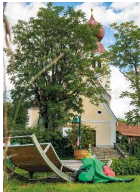
Fünf Hör-genussliegen laden ein...

Ebenso der Zahl Fünf treu sind unsere Hör-genuss-Liegen . Fünf bequeme Liegen an schönen Plätzen, an denen man nicht nur die Seele baumeln lassen kann, sondern auch mittels QR-Code einer Geschichte lauschen kann, die genau zu diesem Plätzchen passt. Die Geschichten wechseln dreimal im Jahr – für Frühling, Sommer und Herbst – es lohnt sich also, öfter mal vorbeizuschauen.