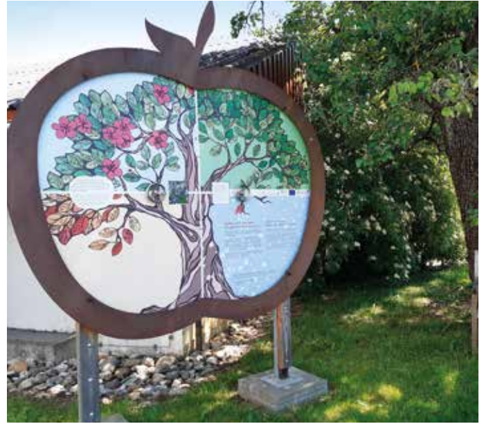
Interaktives Wissensquiz bei der Erlebnisstation bei Pangerl.

Vier Jahre später folgte dann das wohl bekannteste Kunstwerk der Apfelstraße, der Größte Apfel . An der Ortseinfahrt (oder -ausfahrt, je nachdem, aus welcher Richtung man kommt) von Elz überspannt die Holzkonstruktion die Straße und heißt unsere Gäste willkommen. Wie ein Portal in ein magisches Reich führt der Größte Apfel alle Besucher in unsere Apfelwelt. Zum Glück geht es in Elz vom Verkehr her ja beschaulich zu, sodass man durchaus Gelegenheit findet, sich unter dem Apfelbogen zu fotografieren.