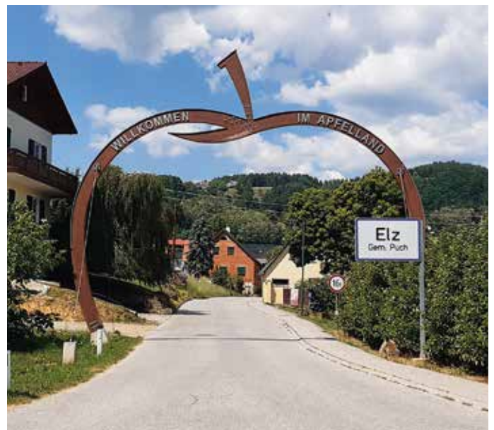
Der „Größte Apfel“ symbolisiert den Eingang ins Genussparadies.