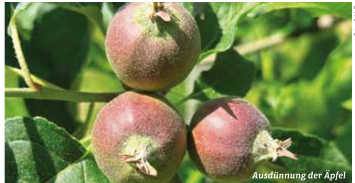
Ausdünnung der Äpfel

...und auf dem Teller! Nachdem wir viele Wochen die Spätfröste erfolgreich abgewehrt haben, wachsen nun die jungen Früchte prächtig heran. Bald geht es bei den Äpfeln an das Ausdünnen – das Entfernen der überzähligen Früchte, damit wir bei der Ernte wieder eine tolle Qualität haben. Aber auch unsere wenigen Beeren und Kirschen entwickeln sich hervorragend.