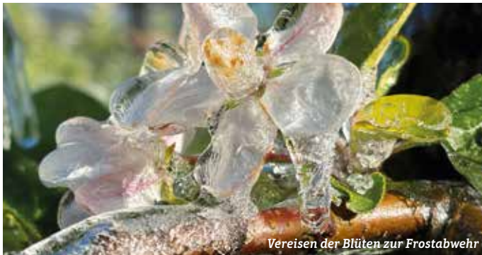
Vereisen der Blüten zur Frostabwehr