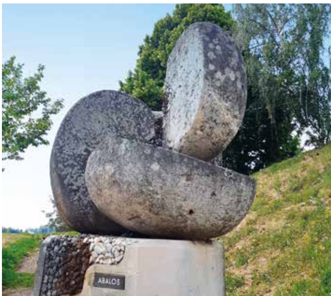
Mehr als bissfest: Abalos – die steinere Apfelskulptur am Hochgartl

Das erste war im Jahr 2000 der Abalos , eine steinerne Apfelskulptur am Aufgang zum Hochgartl in Puch. Saftig sieht er aus, der aufgeschnittene Apfel, aber wohl keiner ist so dauerhaft fest wie er! Ein Kunstwerk von Elisabeth Ledersberger-Lehoczky und Ulrike Chladek, das im Rahmen der Skulpturenstraße 2000 errichtet wurde.