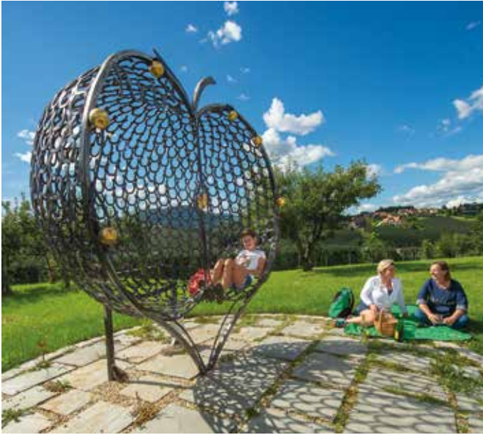
Einzigartig ist der Apfel aus Hufeisen und ebenfalls am Hochgartl zu finden.