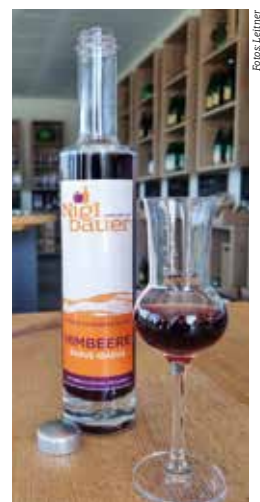
Himbeerlikör – herrlich fruchtig im Geschmack!

Da und dort gibt's auch bei unseren Produkten etwas Neues, wie z.B. einen herrlich fruchtigen Himbeerlikör oder den erfrischenden „ AWWO “ (Apfel-Weichsel-Wossa-Saft). Beide Köstlichkeiten und auch alles andere könnt ihr gerne bei uns am Hof verkosten und einkaufen. Also auf zum Niglbauer und so manch weitere Veränderung selbst entdecken.