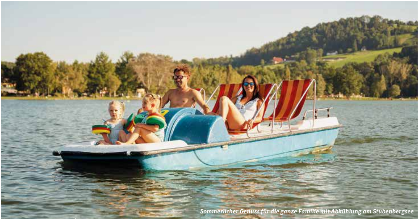
Sommerlicher Genuss für die ganze Familie mit Abkühlung am Stubenbergsee